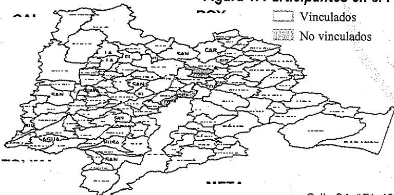
Figura 1. Participantes en el PDA

En la actualidad no se encuentran vinculados al PDA los municipios de Chía, Cogua, y Cota.